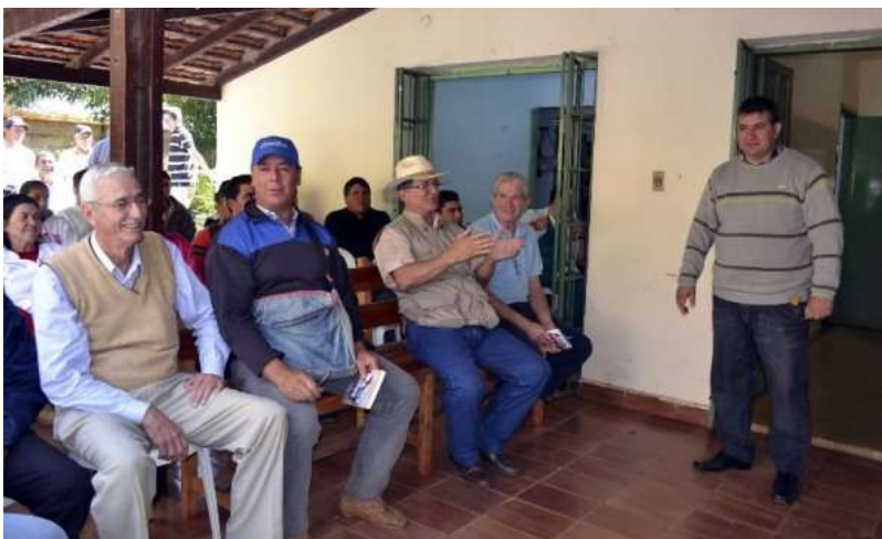
Jornada de capacitación a vacunadores y certificadores en el Senacsa de San Juan Bautista.